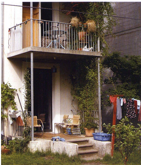
Blick auf die Gartenseite mit den neuen Balkonen.

sein Entstehen für den gemeinnützigen Wohnungsbau zu betonen, schliesslich ist der Wohnungsmangel in Genf längst chronisch. Während der Verkaufsverhandlungen setzten die öffentlichen Dienste dem Ganzen sozusagen die Krone auf, als sie den Besetzern ohne Vorwarnung den Strom abstellten. Dabei hatten diese die Rechnungen stets pünktlich bezahlt. Der Zustand der Installationen machte ein sofortiges Eingreifen nötig, hiess es, sonst bestehe das Risiko eines Stromausfalls im ganzen Strassenzug. Selbst wenn dies zutraf, erstaunte der Zeitpunkt für den Schritt, der vielmehr nach einem bössartigen Vertreibungsversuch aussah. Als die Bewohner merkten, dass die Gegenseite ihre wahren Absichten verbarg, ging sie ihrerseits zum Angriff über. Die junge Genossenschaft CO2P-L71 organisierte eine Pressekonferenz, sammelte mehr als 1100 Unterschriften von Nachbarn, die das Projekt unterstützten, und machte eine Petition beim Grosse Rat. Mit vollem Erfolg: Nach diesem Überraschungsschlag erhielt die Genossenschaft nicht nur die Bewilligung, das Gebäude zu kaufen, sondern auch das Grundstück im Baurecht.