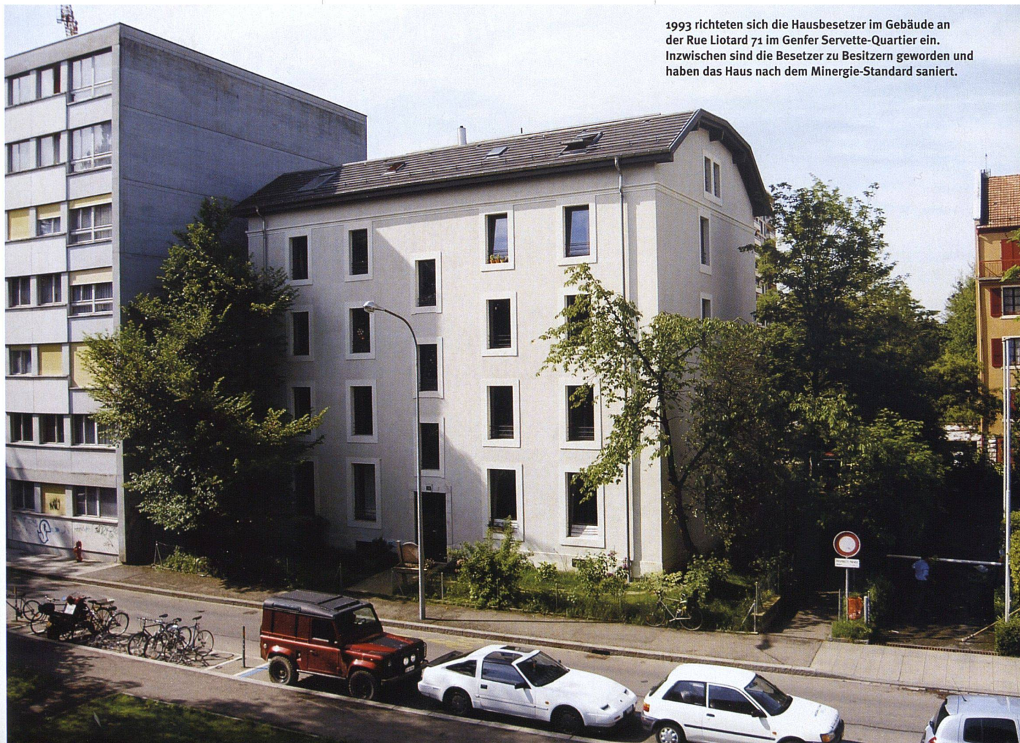
1993 richteten sich die Hausbesetzer im Gebäude an der Rue Liotard 71 im Genfer Servette-Quartier ein. Inzwischen sind die Besetzer zu Besitzern geworden und haben das Haus nach dem Minergie-Standard saniert.