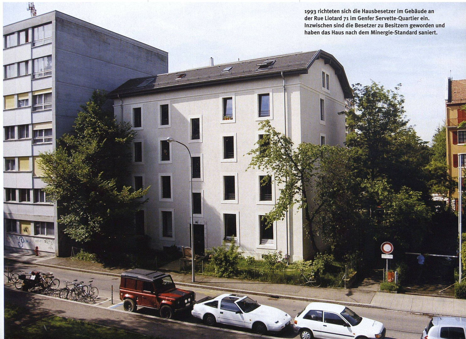
1993 richteten sich die Hausbesetzer im Gebäude an der Rue Liotard 71 im Genfer Servette-Quartier ein. Inzwischen sind die Besetzer zu Besitzern geworden und haben das Haus nach dem Minergie-Standard saniert.