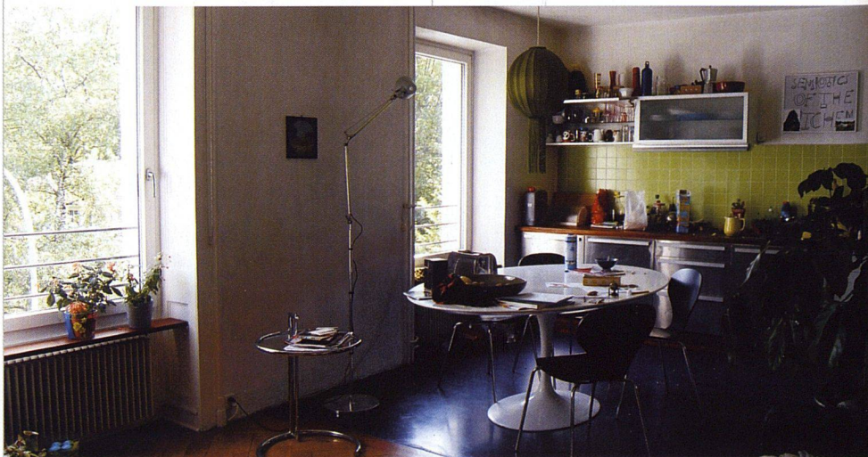
Das grosszügige Wohn-Ess-Zimmer mit offener Küche.