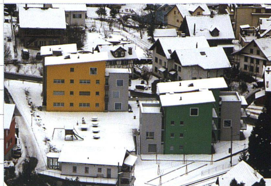
Beispiel eines Projekts, für das die HBG eine Bürgschaft gewährte: der gelbe Neubau der Baugenossenschaft Vitznau.

Natürlich ist die Verbürgung durch die HBG nicht gratis. Dem Kreditbeziehungsweise Bürgschaftsnehmer wird eine jährliche Prämie von ¼ Prozent der Höchsthaftungssumme belastet (Schuldsumme plus in der Regel