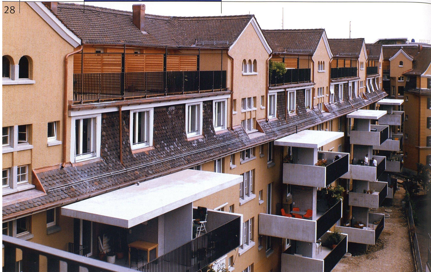
Blick in den Hof mit den neuen Balkontürmen und den individuellen Dachterrassen.