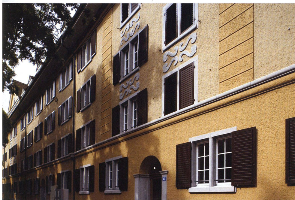
Die Fassaden gegen die Strassenseite durften nicht verändert werden.

BREIT ABGESTÜTZTES PROJEKT. Von Anfang an sei man sich bewusst gewesen, dass beim Eingriff in die Siedlung mit «grösster Sorgfalt» vorzugehen sei, wie der Genossenschaftspräsident bekräftigt. Die BEP liess deshalb ein Konkurrenzverfahren unter drei Architekturbüros durchführen, die bereits Erfahrungen mit ähnlichen Umbauten vorweisen konnten. Im Beurteilungsgremium zog man Fachleute bei, darunter eine Vertreterin der städtischen Denkmalpflege. Dabei hatte das Projekt nicht nur architektonische und denkmalpflegerische Anforderungen zu erfüllen, sondern auch ökologische und nicht zuletzt wirtschaftliche. Am besten tat dies gemäss der Jury der Vorschlag des Büros Pfister Schiess Tropeano & Partner Architekten AG. Er kam nach einer Weiterbearbeitung zur Ausführung – allerdings weniger spektakulär als ursprünglich geplant. So musste die ambitionierte Aussenraumgestaltung zurückgeschraubt werden, obwohl sie das Preisgericht überzeugt hatte: Die vollständige Absenkung des Hofes scheiterte an der Bewilligung der Baubehörden. Doch zunächst galt es, die Genossenschaftsmitglieder vom Projekt zu überzeugen und neue Lösungen für die achtzig bisherigen Mietparteien zu finden. Während die Genossenschafter den 18-Millionen-Kreditantrag problemlos bewilligten, zeigten sich einige, vor allem jüngere Mieter im Industriequartier kritisch. Schliesslich verschwanden hier äusserst günstige Altwohnungen – 620 Franken betrug der Nettomietzins für die Dreizimmer-