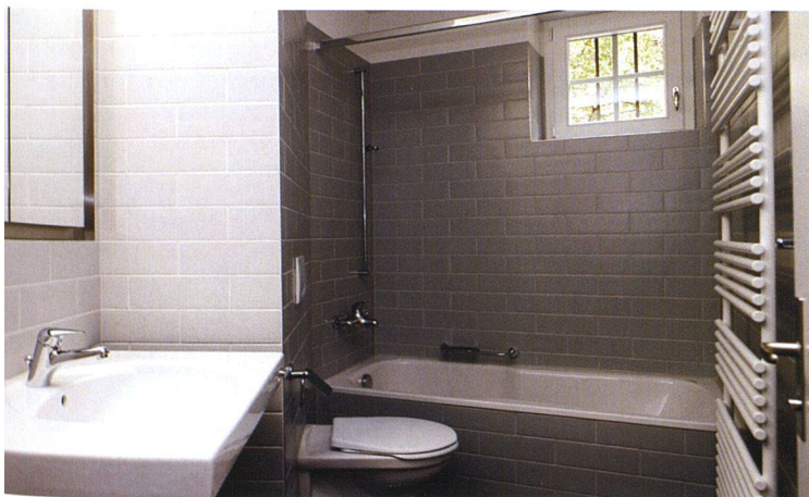
Auch die Bäder und die gesamten Installationen wurden erneuert.