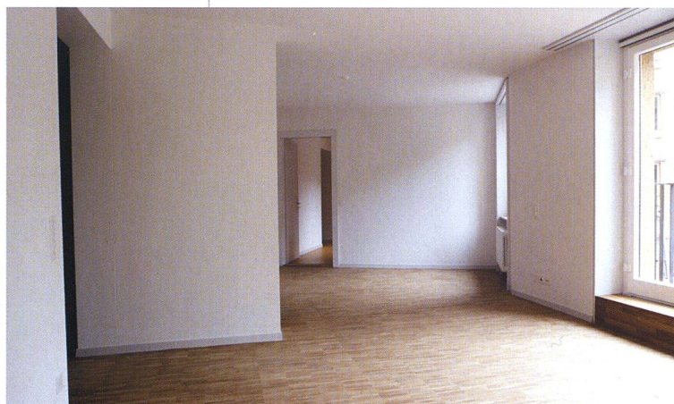
Die fünfzig Wohnungen bieten eine Einmaligkeit, wie dies kein Neubau jemals vermag – dreissig verschiedene Grundrissstypen sind entstanden.