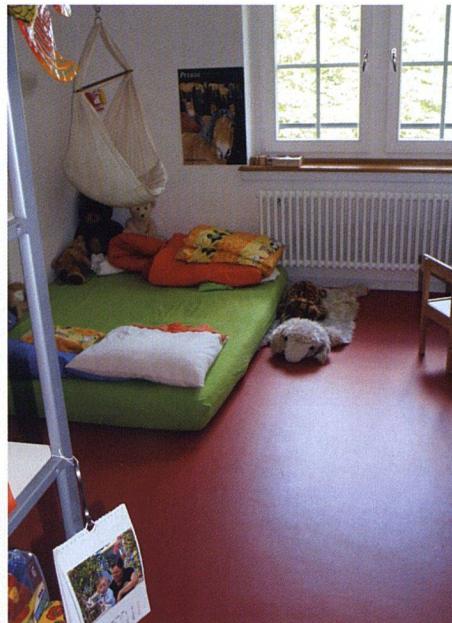
Für die Schlafzimmer wählte man Linoleumböden in unterschiedlichen Farben.