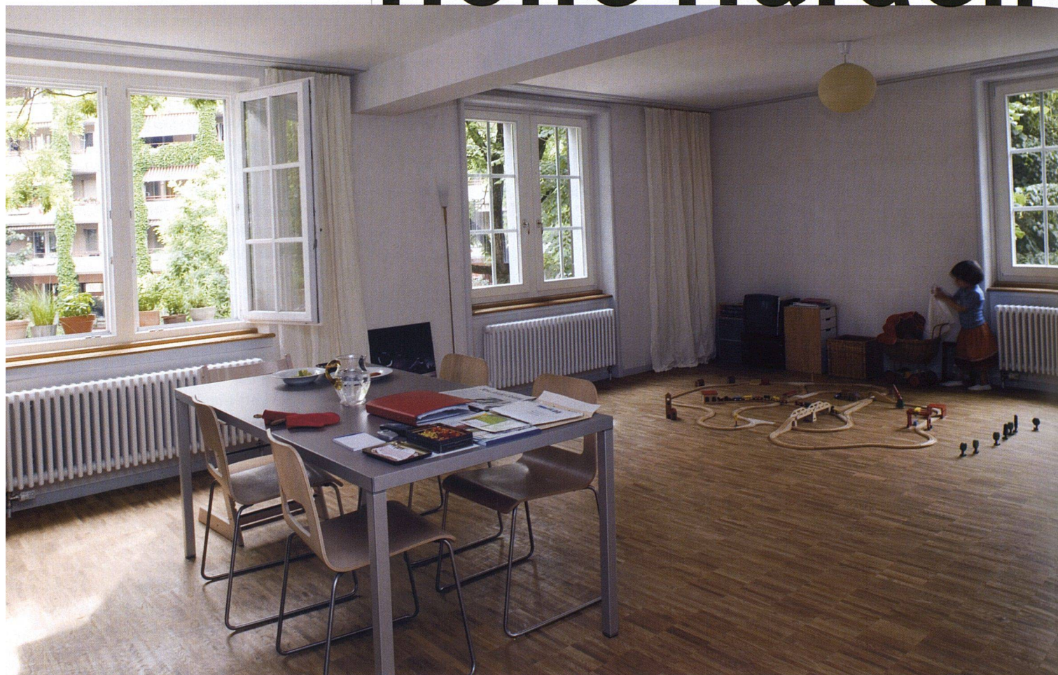
Aus achtzig kleinen Altwohnungen entstanden fünfzig zeitgemässe Familienwohnungen.

Die Blockrandbebauung Industrie 1 der Baugenossenschaft des eidgenössischen Personals (BEP) ist ein wichtiger Zeuge früher Arbeitersiedlungen in der Stadt Zürich. Trotzdem entschied sich die Genossenschaft dafür, die achtzig Wohnungen umzubauen und zusammenzulegen. Dabei war sie vor Überraschungen nicht gefeit.