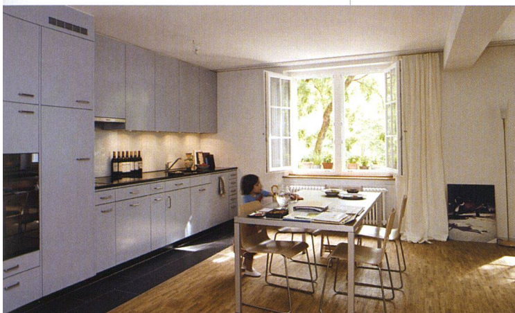
Wohn-Ess-Raum mit offener Küche.

Andererseits, so Urs Baumann, dürfe man feststellen, dass Wohnungen hoher Qualität entstanden seien. 1780 Franken kosten viereinhalb Zimmer mit 104 Quadratmetern Fläche, ein für die zentrale Lage günstiger Mietzins, ▶