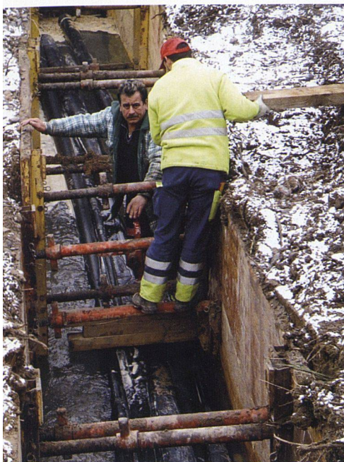
Eine 140 Meter lange Leitung war notwendig, um die Siedlung mit der ARA zu verbinden. Die Ausführung war aufwendig, musste doch die Töss unterquert werden.