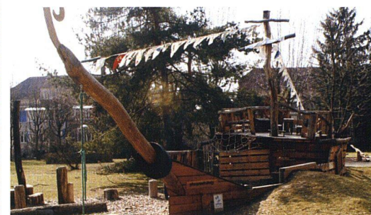
Das Schiff auf hoher See. Es scheint sich fast zu bewegen.