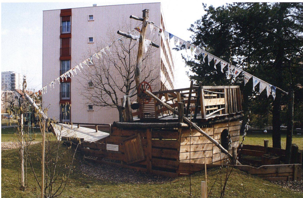
Das Piratenschiff haben die Siedlungsbewohner gemeinsam gebaut.