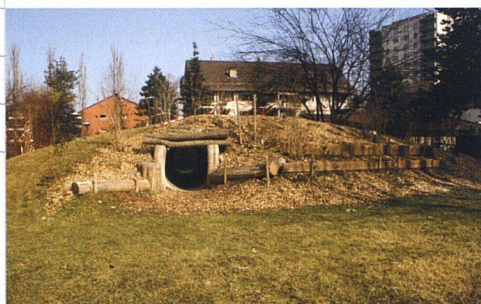
Die Bepflanzung des aufgeschütteten Hügels besorgten die Kinder.

ÜBERRASCHENDER STIMMUNGSWANDEL. Mit einer konkreten Offerte auf dem Tisch ging der Vorstand an die GV 2005, wo die neue Spielplatzidee praktisch oppositionslos genehmigt wurde. Dies habe viel mit der ausgezeichneten Präsentation durch die Initiantin und die Verantwortlichen des Gartenbauunternehmens zu tun gehabt, glaubt Urs Frei, der Kassier. Dabei war das Projekt insgesamt teurer als das ein Jahr zuvor abgelehnte. Es zeige