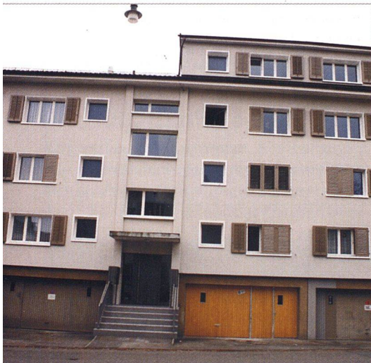
Mit der aufgefrischten Fassade (links) kann sich die Liegenschaft neben den historischen Altbauten wieder sehen lassen.

Die Gemeinnützige Wohnbaugenossenschaft Winterthur (GWG) erneuerte eine Liegenschaft im historischen Dorfkern von Oberwinterthur. Mit grösseren, zeitgemässen Küchen und Bädern, erweiterten Balkonen und neuen Dach-Maisonettewohnungen sorgte sie dafür, dass die Wohnungen auch künftig vermietbar bleiben und ihrer malerischen Nachbarschaft gerecht werden.