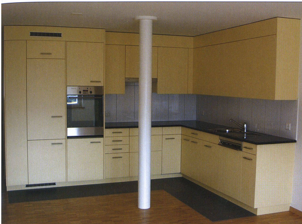
Mit neuen offenen Wohnküchen verlieh die GWG den Wohnungen zeitgemässen Komfort.