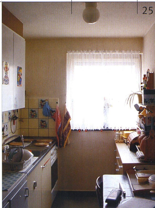
Vorher: Die veraltete Küche bot kaum Platz für einen kleinen Tisch.