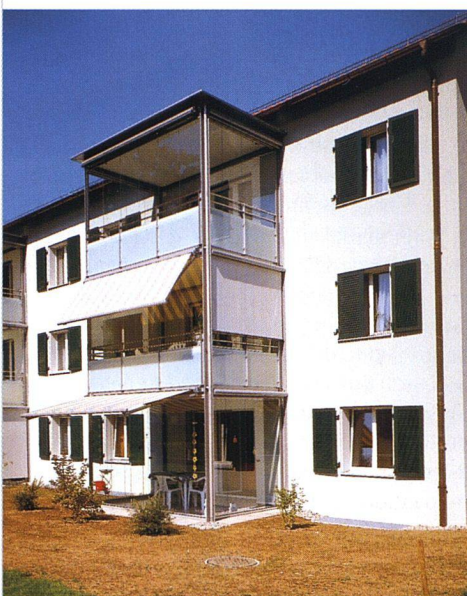
Vorher – nachher: 9-Quadratmeter-Terrassen statt Mini-Balkone.