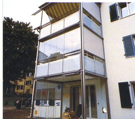
Die verglasten Balkone bzw. Sitzplätze können von Frühling bis Herbst genutzt werden.

äusserst günstige Wohnungen zwischen 400 und 800 Franken bietet, wird man unterschiedlich stark eingreifen. Geplant sind verschiedene Varianten, die auch eine Erweiterung von Küche und Bad umfassen. Bei einem Teil der Wohnungen will man die Zinse jedoch tief halten und nur Fassaden und Balkone erneuern. Damit bleibt ein Angebot für diejenigen Mieter, die mit bescheidenem Budget auskommen müssen.