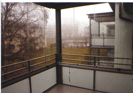
Sitzplatz und Terrasse von innen: viel Licht selbst bei nebligem Wetter.

MIETERFREUNDLICHE KOSTENAUFTEILUNG. Die Kosten überwälzte die Genossenschaft zu 50 Prozent als wertvermehrend auf die Mietzinse, bei einer Abschreibungsdauer von 30 Jahren. Dies ergab einen moderaten Aufschlag von 150 Franken, so dass die 4-Zimmer-Wohnungen nun auf 800 bis knapp 1000 Franken einschliesslich Nebenkosten zu stehen kommen. Die ersten Erfahrungen sind positiv: Nicht nur dass die Bewohner die Balkone bis