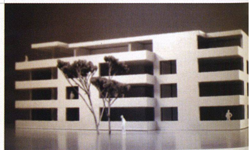
Die BG Zürichsee will in Küsnacht zeitgemässe Neubauten erstellen.

Die Baugenossenschaft Zürichsee will ihre Siedlung Unterfeld in Küsnacht ersetzen. Die vier Häuser im Heslibachquartier entstanden zwischen 1926 und 1962 und weisen kleine Grundrisse, einen bescheidenen Ausbau sowie eine mangelhafte Bausubstanz auf. Sie sollen nun einer neuen Überbauung mit einer zeitgemässen Architektur und einer nachhaltigen Bauweise weichen. Die Baugenossenschaft möchte preisgünstige Wohnungen mit guten Grundrissen, optimaler Besonnung und hochwertiger städtebaulicher Eingliederung erstellen. Insbesondere der letzte Punkt gab denn auch den Ausschlag für das Projekt des Architekturbüros Egli Rohr Partner AG, das aus dem Architekturwettbewerb als Sieger hervorging: Die geschickt platzierten Gebäude führen die Qualität der bisherigen Quartierstruktur fort und stehen im Einklang mit den benachbarten Häusern. Zwischen den drei Baukörpern öffnet sich ein zentraler Aussenraum. Pro Geschoss sehen die Architekten