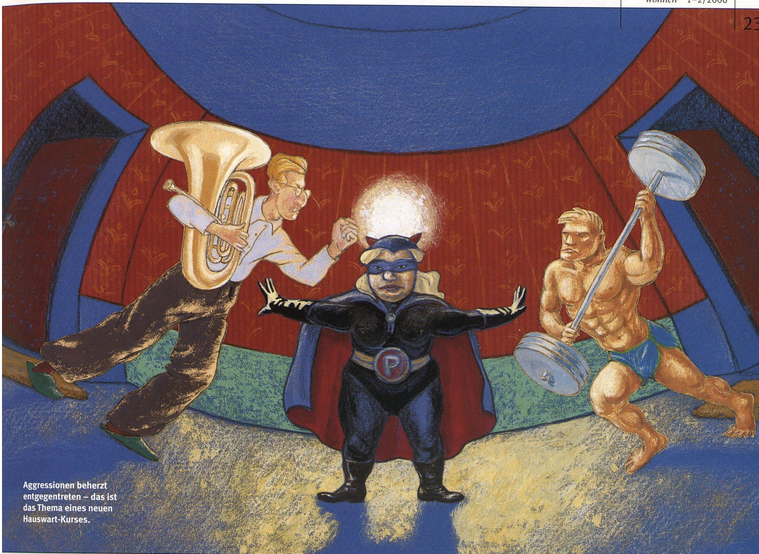
Aggressionen beherzt entgegnetreten – das ist das Thema eines neuen Hauswart-Kurses.