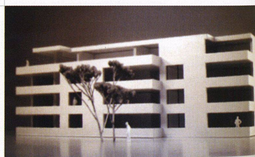
Die BG Zürichsee will in Küsnacht zeitgemässe Neubauten erstellen.

Die Baugenossenschaft Zürichsee will ihre Siedlung Unterfeld in Küsnacht ersetzen. Die vier Häuser im Heslibachquartier entstanden zwischen 1926 und 1962 und weisen kleine Grundrisse, einen bescheidenen Ausbau sowie eine mangelhafte Bausubstanz auf. Sie sollen nun einer neuen Überbauung mit einer zeitgemässen Architektur und einer nachhaltigen Bauweise weichen. Die Baugenossenschaft möchte preisgünstige Wohnungen mit guten Grundrissen, optimaler Besonnung und hochwertiger städtebaulicher Eingliederung erstellen. Insbesondere der letzte Punkt gab denn auch den Ausschlag für das Projekt des Architekturbüros Egli Rohr Partner AG, das aus dem Architekturwettbewerb als Sieger hervorging: Die geschickt platzierten Gebäude führen die Qualität der bisherigen Quartierstruktur fort und stehen im Einklang mit den benachbarten Häusern. Zwischen den drei Baukörpern öffnet sich ein zentraler Aussenraum. Pro Geschoss sehen die Architekten