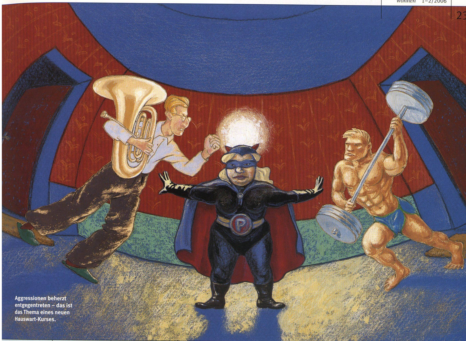
Aggressionen beherzt entgegnetreten – das ist das Thema eines neuen Hauswart-Kurses.