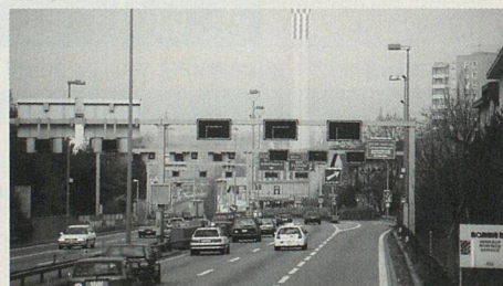
110 000 Autos fahren auf dem Autobahnabschnitt 1.4.4 heute täglich durchs Quartier (links). Die Einhausung würde für die Anwohner das Ende von Lärm- und Staubbelastung bedeuten, gleichzeitig entstünde ein attraktiver Grüngürtel.