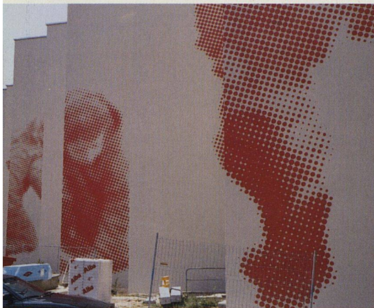
Die künstlerische Fassadengestaltung symbolisiert die kinderfreundliche Siedlung mit grossem Hof, Kindergarten und Hort.