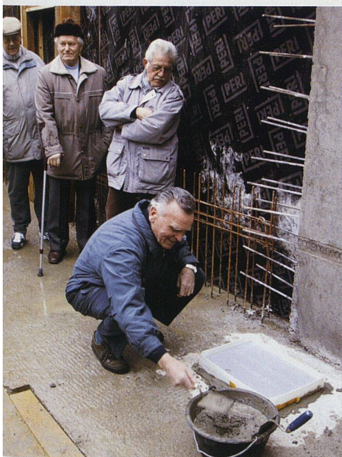
Auch kleine Genossenschaften wie die Burgmatte in Zürich (rund 80 Wohnungen) können Neubauprojekte erfolgreich abwickeln: Im Bild Vorstandsmitglieder beim Setzen des Grundsteins (siehe auch wohnen 5/2004).