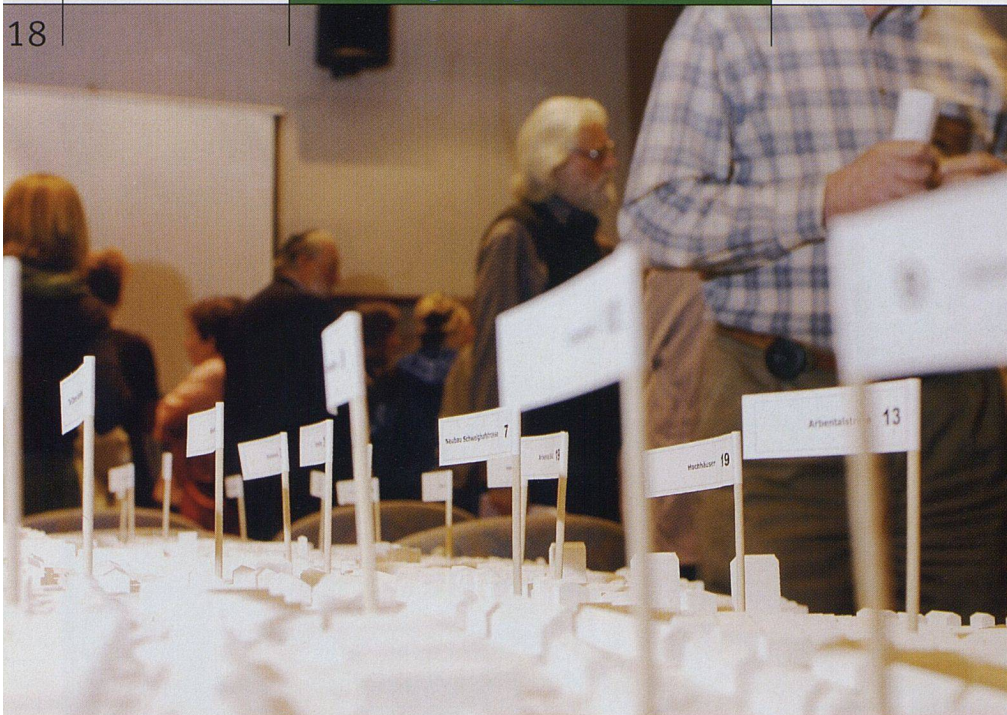
Die städtebaulichen Konzeptideen wurden grafisch umgesetzt, um sie den Bewohnerinnen und Bewohnern anschaulich zu präsentieren.