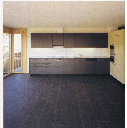
Hohe Qualität findet sich auch beim Innenausbau.