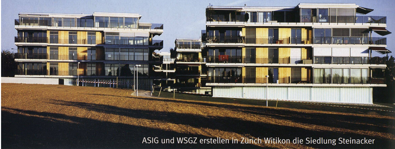
ASIG und WSGZ erstellen in Zürich Witikon die Siedlung Steinacker