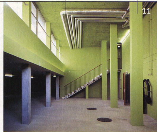
Dank Oberlicht und Farbkonzept sind die Tiefgaragen für die Bewohner zum Ort der Begegnung geworden.

men. Dem an derselben Strasse gelegenen Kranken- und Pflegeheim wurden in der Siedlung Steinacker zwei 4½-Zimmer-Wohnungen als zusammenhängende Pflegewohnung eingerichtet. Die für eine solche Nutzung notwendigen Mehrkosten übernahm die Stadt Zürich. Umgekehrt machte es ein schon früh abgeschlossener Energienutzungsvertrag mit dem Krankenhaus möglich, dass in der Siedlung auf eine Heizzentrale und Kaminan-