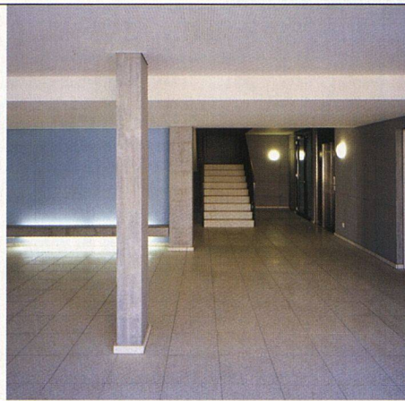
Die Farbgestaltung wertet die Eingangshalle im Sockelgeschoss auf.

NACHBARSCHAFTSHILFE GEGENSEITIG. Zu einer ungewöhnlichen Form gegenseitiger Nachbarschaftshilfe ist es bereits während der Planung der Siedlung Steinacker gekom-