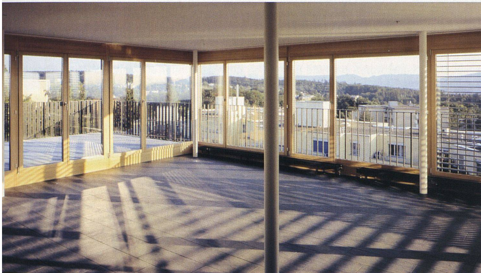
Viel Glas und grosse Terrassen sorgen für die bestmögliche Nutzung der Aussichtslage.

WÜRFEL LÖST ZEILENFORM AB. Fünf wuchtige Baukörper bilden zusammen ein Ensemble, das unterschiedliche Zwischenräume für den siedlungseigenen Gebrauch eröffnet. Jeder der identischen Baukörper besitzt eine eigene Ausrichtung im Hang, wodurch die Zwischenräume von Mal zu Mal wechselnd eine eigene Ausprägung erhalten. Die zurückhaltend bepflanzten Hofräume werden wohl vor allem durch Kinder in einem der drei eingerichteten Spielplätze genutzt. Auch diese Siedlung schreibt damit eine typologische Entwicklung im schweizerischen Wohnungsbau fort, die mit würfelartigen Volumen mehr dem autonomen Status des einzelnen Baukörpers, weniger aber einer – vermeintlich richtigen – Einordnung der Siedlung ins