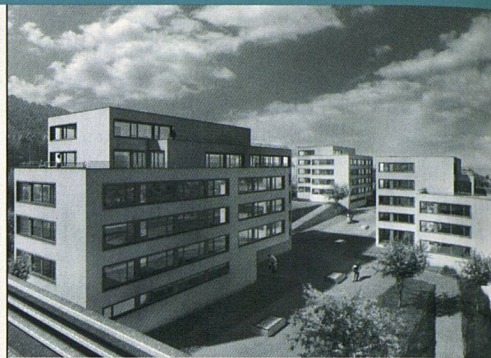
Die von Althammer Hochuli Architekten AG entworfenen Neubauten am Entlisberg in Zürich-Wollishofen (Baugenossenschaft der Strassenbahner Zürich).

fallen durch räumliche Grosszügigkeit und ausgezeichnete Lichtverhältnisse auf. Der häufigste Typ mit viereinhalb Zimmern bietet 115 Quadratmeter Nettowohnfläche. Für das Projekt mit Baubeginn Mitte 2005 gaben die Genossenschaftsmitglieder an der diesjährigen Generalversammlung grünes Licht. Sie genehmigten zudem den Kauf eines Grundstücks, das an die Stammsiedlungen der Genossenschaft beim Bucheggplatz angrenzt. In unmittelbarer Nähe zum Schulhaus Allenmoos kann dort nun ein Bau mit acht Familienwohnungen erstellt werden. (ri)