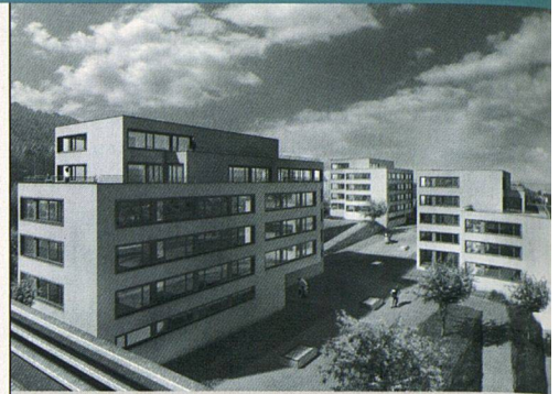
Die von Althammer Hochuli Architekten AG entworfenen Neubauten am Entlisberg in Zürich-Wollishofen (Baugenossenschaft der Strassenbahner Zürich).

fallen durch räumliche Grosszügigkeit und ausgezeichnete Lichtverhältnisse auf. Der häufigste Typ mit viereinhalb Zimmern bietet 115 Quadratmeter Nettowohnfläche. Für das Projekt mit Baubeginn Mitte 2005 gaben die Genossenschaftsmitglieder an der diesjährigen Generalversammlung grünes Licht. Sie genehmigten zudem den Kauf eines Grundstückes, das an die Stammsiedlungen der Genossenschaft beim Bucheggplatz angrenzt. In unmittelbarer Nähe zum Schulhaus Allenmoos kann dort nun ein Bau mit acht Familienwohnungen erstellt werden. (rl)