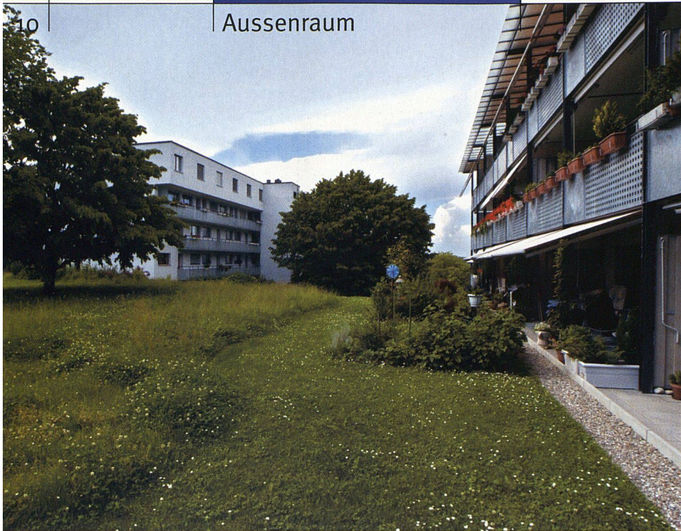
Über die Terrassen der Erdgeschosswohnungen gelangt man direkt in den Garten. Die hausnahen Flächen werden von den Bewohnern genutzt. Der Übergang zur gemeinschaftlichen Blumenwiese ist fließend. Die Pflege der Wiesenfläche wird extensiviert (FGZ-Siedlung Friesenberghalde).

auch der Aussenraum erneuert werden. Die Freiräume der Siedlung waren bisher nicht durch die Gartendenkmalpflege beurteilt worden. Deshalb galt es dringend, vor Beginn der Arbeiten die vorhandenen Qualitäten im Freiraum zu erfassen und mögliche schutzwürdige Elemente zu bestimmen. Ein 2001 erstelltes Gutachten zeigt, wo die Qualitäten der Freiräume liegen. Die räumliche Grundstruktur und klare Zuordnung der Flächen zu einzelnen Gebäuden bildet ein starkes Grundgerüst, das seit der Entstehungszeit (1911 bis 1919) kaum verändert wurde. Individuell aneignbare Sitzplätze und Vorgärten an den Häusern fliessen über in halböffentliche Spielwiesen und Plätze. Die Freiräume sind auf die Bedürfnisse der Bewohner ausgerichtet und werden auch heute rege genutzt. Trotzdem gibt es neue Wünsche und Ansprüche wie Velostellplätze oder weitere Sitzplätze. Das Gutachten dient als Entscheidungshilfe dafür, welche Veränderungen im Freiraum möglich sind. Es ist das Konzept zur Sanierung. Oberstes Ziel ist die Sicherung und der Erhalt der hohen vorhandenen Qualitäten.