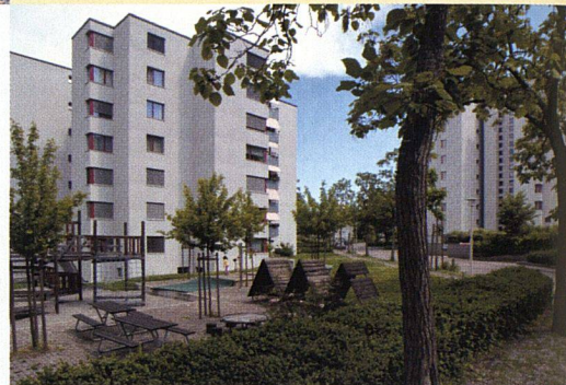
Blick über den Spielbereich der Friesenberghalde in den Strassenraum. Geschnittene Buchshecken sind prägend für die Eingangsbereiche. Die Wachstumsbedingungen für die Strassenbäume konnten durch offene, gekieste Baumscheiben verbessert werden.

Die Liste der Massnahmen ist lang: Klärung der Eingangsbereiche, Vergrösserung der Freiräume des Kindergartens, attraktivere Gestaltung der Spiel- und Aufenthaltsbereiche durch neue Ausstattungselemente, Neuorganisation und Gestaltung der Kompost- und Containerstandorte, Behebung sicherheitstechnischer Mängel, abwechslungsreiche Bepflanzung. Monotone Pflanzflächen wurden gerodet, Rasenflächen durch Blumenwiesen ergänzt. In den Wiesen und an den Rändern der Siedlung pflanzte man vielfältige, einheimische Arten. Entlang der Strasse und an den Eingängen entschied man sich dagegen für kultivierte, zum Teil ge-