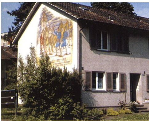
Die Reiheneinfamilienhäuschen wirken nach der Modernisierung frisch und zeitgemäss.