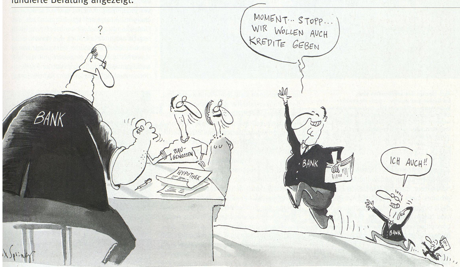
Illustration: Max Spring

Das Interesse der Banken am Hypothekengeschäft ist markant gestiegen. Vor allem für kleinere und mittlere Baugenossenschaften bedeutet dies allerdings nicht zwingend bessere Konditionen. In jedem Fall sind das Einholen von Konkurrenzofferten sowie eine fundierte Beratung angezeigt.