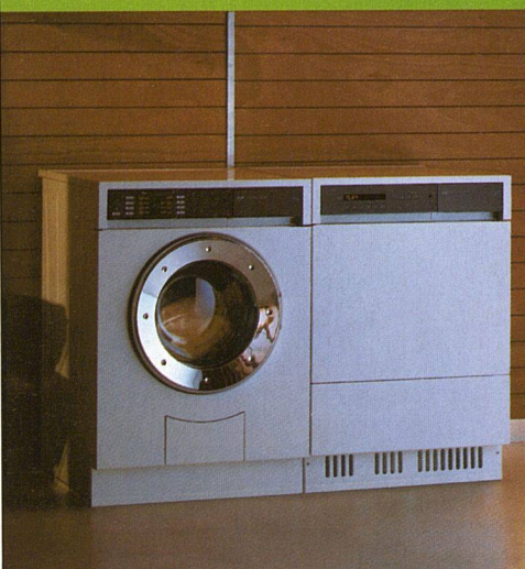
V-Zug AG 6301 Zug Telefon 041 767 67 67 www.vzug.ch

Die neue Adora-Generation von V-Zug sorgt für grosses Aufatmen: Die Adora entknittert als erster Waschautomat die Wäsche mit Dampf und macht das Bügeln so bequem und schneller denn je. Die Wirksamkeit dieses Programmes wurde durch das Schweizer Institut Testex bereits nachgewiesen und bestätigt. Eine weitere Neuheit ist das Milbenstopp-Programm. Für diese Innovation von V-Zug sind besonders Allergiker dankbar. Während mindestens einer Stunde läuft dieses Programm bei 60 Grad. Anschliessend wird alles so gründlich ausgespült, dass nichts übrig bleibt. Gut, wenn Waschautomaten und Wäschetrockner zusammenarbeiten. Noch besser, wenn sie sich in die Hände arbeiten. Darum bringt V-Zug die erste vernetzte und kommunizierende Wasch-Trocken-Kombination. Das raffinierte Dialog-System sorgt für besonders schnelles und schonendes Trocknen der Wäsche.