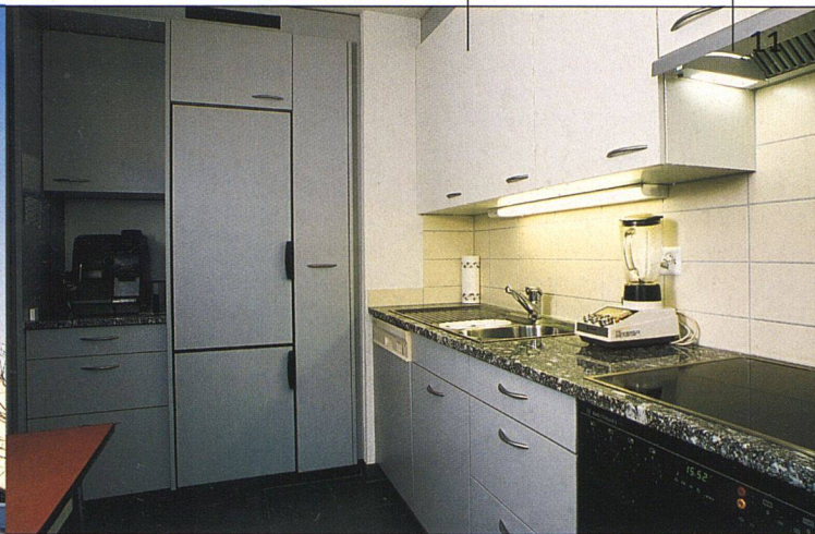
In renovierten Küchen sind moderner Komfort wie grosse Kühlschränke mit separatem Tiefkühler sowie Glaskeramik- und Natursteinabdeckungen heute Standard. (Herbstweg, Asig)