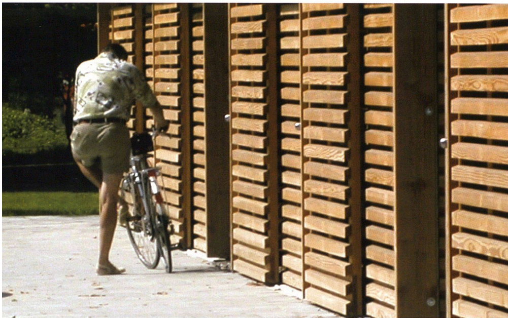
Mit seinen rostartigen Paneelen aus Fichtenholz wirkt der Unterstand im Hof wie ein Vorhang.

nierte Profil dieser Konstruktion schafft eine nun unzweideutige Grenze zwischen Strassen- und Siedlungsraum. Durchlässig ist der Unterstand dagegen vom Hof aus gesehen. Aus Fichtenholz vorfabrizierte Schiebetüren bilden die Eingangsbereiche zu den einzelnen Abstellkojen. Aneinander gereiht wirken die rostartig ausgebildeten Paneele wie ein Vorhang, der erst richtig aufmerksam macht auf das, was er