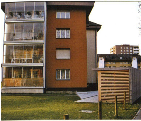
Erweiterte und verglaste Balkone erhöhen die Wohnqualität gegen den südlichen Hofraum.