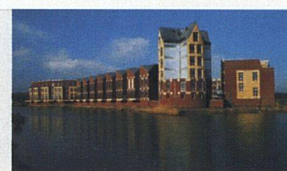
Frank-Bertolt Raith | Lars Hertelt | Rob van Gool Inszenierte Architektur Wohnungsbau jenseits des Standards

Frank-Bertolt Raith, Lars Hertelt, Rob van Gool Inszenierte Architektur 160 Seiten, 220 Bilder, 155 CHF Deutsche Verlags-Anstalt, Stuttgart/München 2003