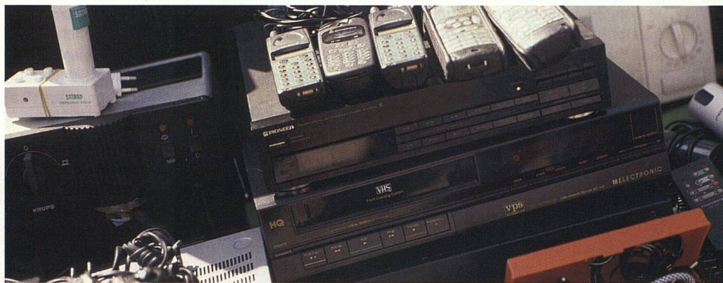
Elektrogeräte werden immer billiger. Kein Wunder, dass sie in den meisten Haushalten zu Dutzenden herumstehen. Sie sind meist die Hauptquellen für Elektromog.

AM RAND ANERKANNTER WISSENSCHAFTLICHKEIT. Ungeachtet dieser abwartenden Haltung suchen viele Menschen die Gründe für gesundheitliche Probleme bei verschiedensten Umwelteinwirkungen. Damit steigt die Nachfrage nach entsprechenden Dienstleistungen. Schon seit Jahren haben an den Rändern anerkannter Wissenschaftlichkeit «Elektromog-Spezialisten» begonnen, die von der «Wissenschaft» schwer feststellbaren Kausalitäten auf eigene Faust zu erkunden. «Elektrobiologisch» geschulte Firmen messen und beurteilen vorhandene elektromagnetische Felder, bieten Beratung zur Verbesserung der durch Elektromog beeinträchtigten Gesundheit und entwickeln