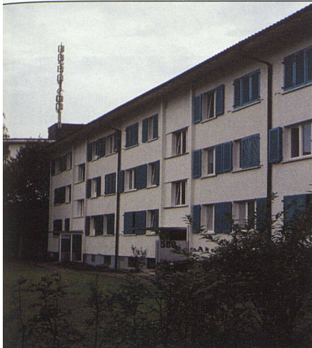
Die Gefahr von Mobilfunkantennen wird oft überschätzt. Nur wenige Wohnungen sind deswegen hoher Strahlung ausgesetzt.

Nein, sie sind generell überschätzt. Nur wenige Leute leben wirklich im Emissionsbereich von Hochspannungsleitungen. Hohe Strahlungswerte von Mobilfunkantennen sind im Wohnbereich ebenfalls eher selten. Nur die Bewohner in unmittelbarer Nähe eines Daches mit Mobilfunkantenne haben ein wirkliches Problem. Die Hauptursachen für die Entstehung von Elektromog im Siedlungsbereich sind vielmehr in der Konstruktionsart der Gebäude, der Art der verwendeten Haustechnik und den zahlreichen elektrischen Geräten der BewohnerInnen zu suchen. Wir haben heute grundsätzlich viel mehr Schwierigkeiten mit dem Schwachstrom als mit Starkstrom. Jeder PC, jeder Drucker, jedes Telefon, jeder Lautsprecher kann heute höhere Feldstärken abstrahlen als Schalterleitungen. Das macht die Leute kaputt! Zusammen mit Netzurückwirkungen über Neutralleiter und Erdungen bilden die Geräte selber heute die Hauptursachen für Elektromog in Wohnbereichen.