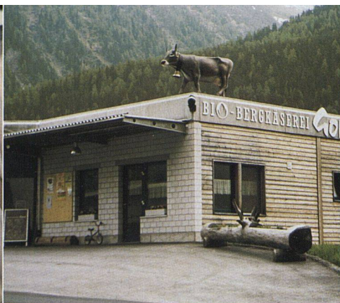
Zwölf Landwirte gründeten die genossenschaftliche Bio-Bergkäserei Goms in Glurigen, nachdem die frühere Käserei Konkurs angemeldet hatte.