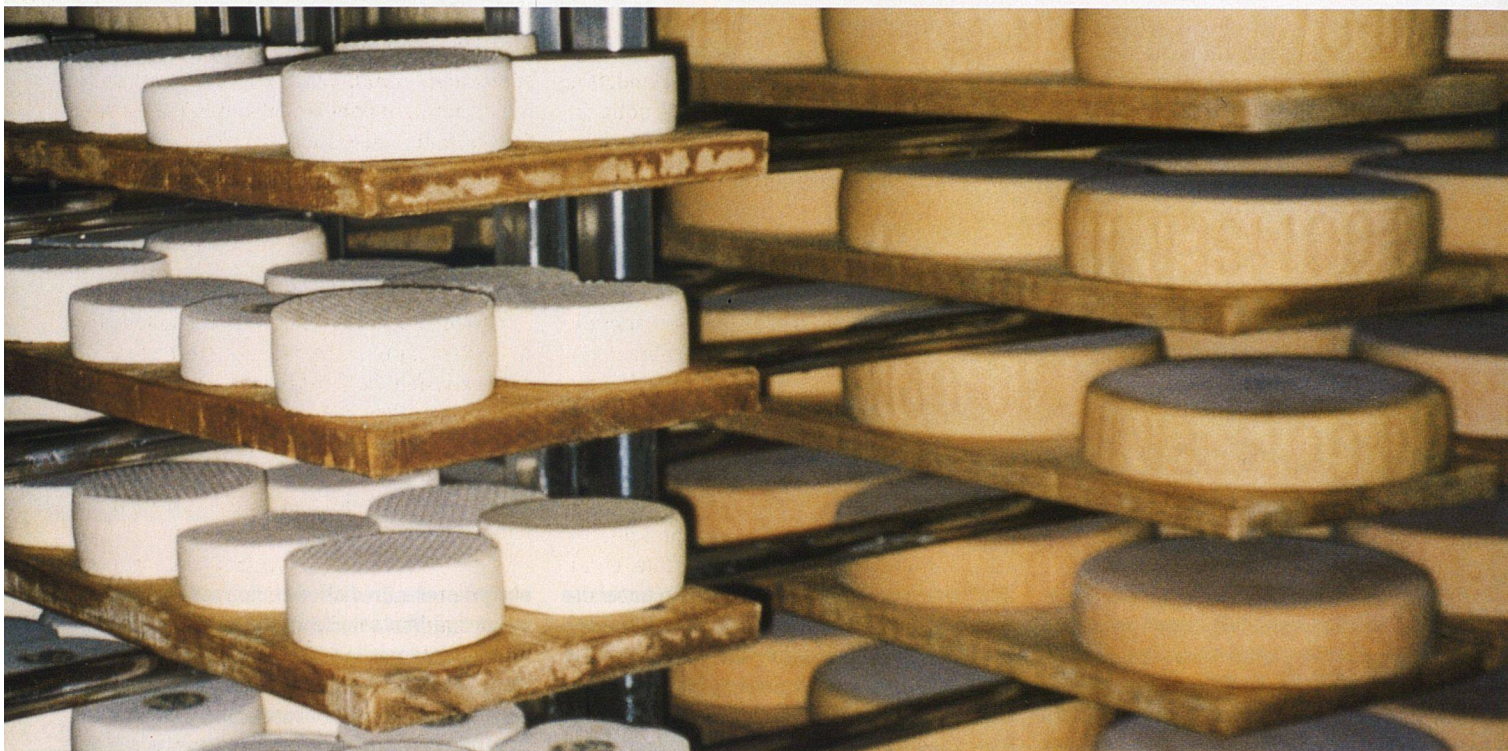
Die Rinde des unreifen Käses im Keller ist noch blass. Rechts im Bild der Biogomser.

Um zu überleben, haben zwölf Bauernfamilien im Goms im Oberwallis ihre eigene Bio-Bergkäserei gegründet. Als Genossenschafter sind sie Miteigentümer des jungen Betriebs, der allerdings noch rote Zahlen schreibt.