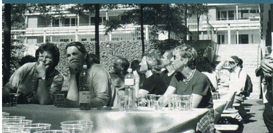
Der Neubau Rietgraben in Wallisellen war die letzte Station der diesjährigen Besichtigungstour des SVW Zürich.