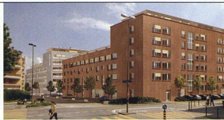
Diesem markanten Bau an der Landenbergstrasse muss das heutige Jugendhaus Wärrchhof weichen, für das jedoch ein neuer Standort in der Nähe gefunden werden konnte.