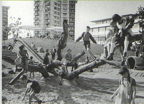
Der Spielplatz im Park Heiligfeld in den Fünfzigerjahren ...

Grün Stadt Zürich erhielt den Auftrag, ein Projekt für die Verbesserung der Parkanlage zu entwickeln, was unter Einbezug der Wohnbevölkerung geschah. An einem Gesprächsforum tauschte man Ideen aus. Zwei Themen-