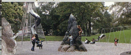
... und fünfzig Jahre später.

felder standen im Mittelpunkt: Die notwendige Aufwertung der Aussenräume und die soziokulturellen Anliegen. VertreterInnen der Wohnsiedlungen rund um den Park bildeten eine Arbeitsgruppe zur Ergänzung der stadtinternen Projektgruppe. Das erste erarbeitete Konzept wurde ein Flop. Die Velohäuschen in den Höfen und Stewis anstelle der alten Wäschestangen stiessen auf Ablehnung. Diese Einwände nahm man ernst, und ein völlig neues, von den BewohnerInnen befürwortetes Projekt entstand.