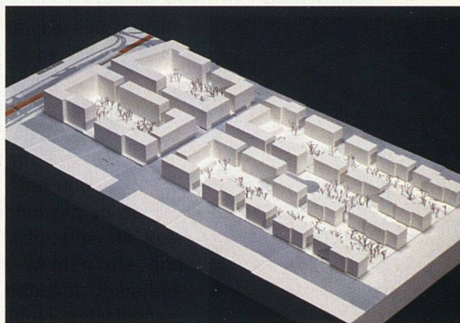
Das Siegerprojekt des Büros von Ballmoos Krucker sieht zwölf Häuser mit 160 grossen Wohnungen vor.