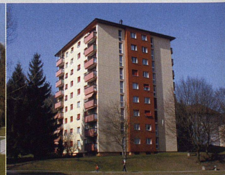
Liegenschaften der Genossenschaften Allmend, Arve und Gstdalen in Horgen.