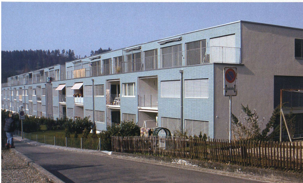
Vom Sitzplatz über den französischen Balkon bis zur grosszügigen Terrasse reichen die unterschiedlichen Aussenräume.

Die überdurchschnittliche Tiefe der Gebäude von rund 14 Metern ermöglichte neben der Reduktion der Gebäudeoberflächen ein einfaches, leicht zu variierendes Grundrisschema. Jeweils um einen Nasszellenkern herum gruppieren sich der Wohn- und Essraum mit der dazu gehörigen Küche sowie, je nach Wohnung, ein bis vier weitere Zimmer. Ihre geschickte Ausbildung als Schaltzimmer machte die oben angesprochene Planungsflexibilität möglich. Innen wie aussen kamen betont einfache Materialien zum Einsatz. Die Wohnräume sind mit Parkettböden ausgestattet, die einzelnen Zimmer mit Linoleumböden. Aussen prägt die bläulich eingefärbte Eternitfassade das Bild der neuen Überbauung. Die Stirnseiten sind jeweils mit Aussen-