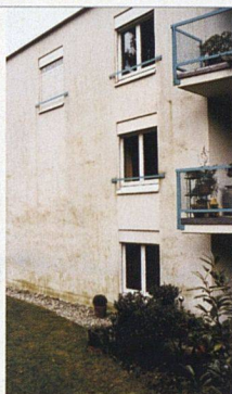
Starker Algenbefall überzieht die Nordfassade bis knapp unter das Flachdach.

PROBLEMATISCHE DÄMMUNG. Bei der Siedlung in Höngg traten auch im Sockelbereich an exponierten Stellen wie Schattenseiten, Maueranschlüssen und Lichthöfen Schäden durch Feuchtigkeit auf. Dabei hatte man die