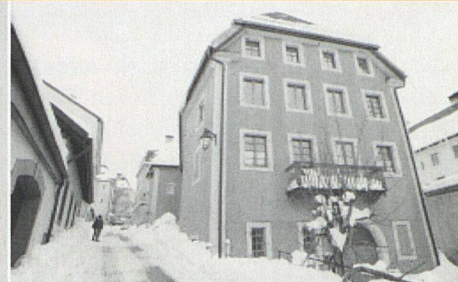
Das Haus der Genossenschaft Rocher 12 in La Chaux-de-Fonds ist nun mit Sonnenkollektoren ausgestattet.