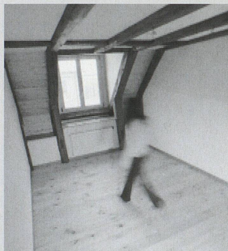
Blick in die renovierte Wohnung.

*Dieser Beitrag beruht auf einem Text von Giovanni Sammali.