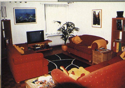
Im Wohnzimmer wird nicht weniger ferngesehen als anderswo.

auf freiwilliger Basis, das heisst von Seiten der Eltern und/oder des Jugendlichen. Vielleicht braucht es mal hier oder da behördlichen Druck. Mit Zwang allein stünden die Neuankömmlinge jedoch vor einer denkbar schlechten Ausgangslage. Aber auch wer freiwillig hierher kommt, bleibt nicht immer die anvisierte Mindestdauer von zwei Jahren. Es kommt vor, dass Jugendliche das Heim als Gefängnis empfinden, sie fühlen sich komplett eingeeignet, weil da plötzlich einer kommt und sagt: «Um 23 Uhr bist du dann zu Hause.» Für andere wiederum kommt der Eintritt einer Erleichterung gleich.