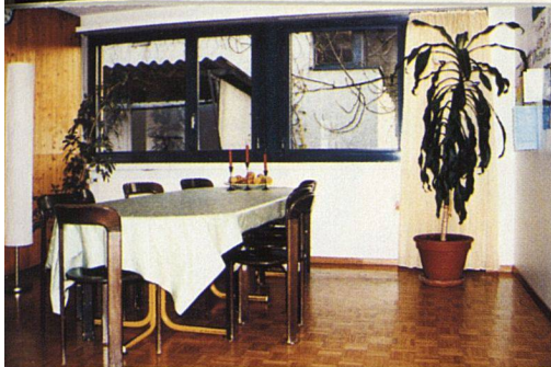
Blick von der Diele ins Esszimmer.