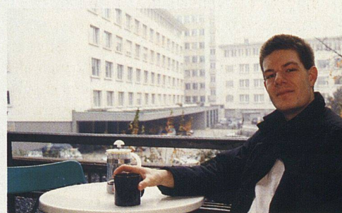
«Ultraschmaler Balkon nervt», Hermes.

Genossenschaft Räume gebe, wo man andere Leute trifft. Dass die in dieser innerstädtischen Siedlung fehlen, störe ihn aber nicht: «Die zentrale Lage und der günstige Preis sind uns wichtiger.»