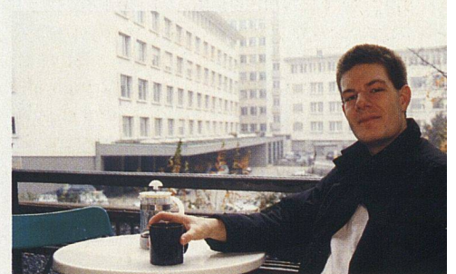
«Ultraschmaler Balkon nervt», Hermes.

Genossenschaft Räume gebe, wo man andere Leute trifft. Dass die in dieser innerstädtischen Siedlung fehlen, störe ihn aber nicht: «Die zentrale Lage und der günstige Preis sind uns wichtiger.»