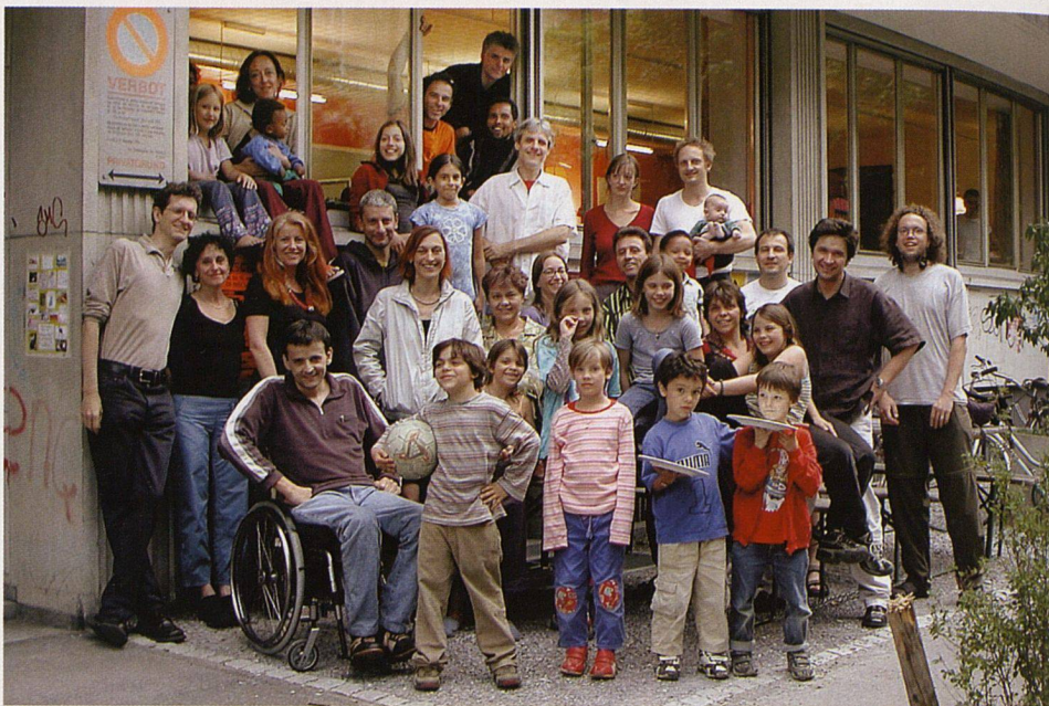
In Karthago, dem vertikalen Dorf an der Zentralstrasse 150, leben Menschen mehrerer Generationen im Alter von 4 Monaten bis zu 74 Jahren.