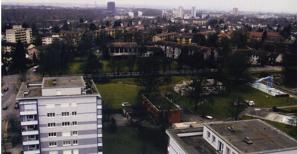
Schwamendingen verdichten? Wegen der dringend notwendigen Erneuerung vieler Liegenschaften steht das Quartier, eine Hochburg der Baugenossenschaften, vor tief greifenden Veränderungen.

Titel «Boomgebiete der Zukunft – die Stadtrandquartiere», die am 25. September um 20 Uhr im Kongresszentrum Spigarten in Zürich-Altstetten stattfindet. Sie geht davon aus, dass nach Zürich-Nord und Zürich-West die neuen Boomgebiete Altstetten, Schwamendingen, Seebach und Affoltern heissen. Dort, wo die grossen Siedlungen der Baugenossenschaften stehen, wird in den kommenden Jahren saniert, umgebaut und abgerissen. Gleichzeitig dürfen diese Gebiete wegen der neuen Bau- und Zonenordnung sehr viel dichter bebaut werden. Die Umgestaltung am Stadtrand dürfte damit zu den brisantesten stadtentwicklungs-politischen Themen der nächsten Jahre und Jahrzehnte zählen. Für wen wird hier gebaut? Wird sich die Lebensqualität verbessern oder verschlechtern? Können die jetzigen BewohnerInnen mitbestimmen? Über diese Fragen diskutieren Kathrin Martelli, Vorsteherin Hochbaudepartement, Niklaus Scherr, Mieterverband, Markus Zimmermann, Förderstelle Gemeinnütziger Wohnungsbau, Catherine Rutherford, Arbeitsgruppe Staudenbühl Gewobag, Gunthard Niederbäumer, BG Glattal, Gesprächsleitung: Richard Wolff, Stadtforscher.