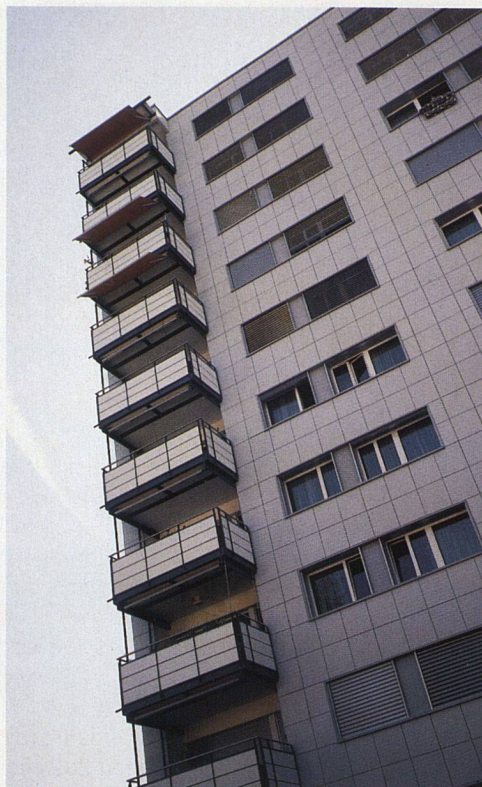
Ein Hochhaus ist bereits saniert.

PFLEGEWOHNUNG IM HOCHHAUS. Beim Bau der Siedlung 1970 war es ein Ziel gewesen, kleinere wie auch grössere Wohnungen in derselben Siedlung anbieten zu können. Dahinter stand die Idee, dass Eltern nach dem Ausziehen ihrer Kinder die Möglichkeit haben, in eine kleinere Wohnung zu wechseln, ohne die Siedlung verlassen zu müssen. Dieser Gedanke erhält jetzt in einem der beiden Hochhäuser eine Fortsetzung im Hinblick auf das höhere Alter. Dort wird nämlich eine Pflegewohngruppe eingerichtet. Die Genossenschaft hat das dritte Stockwerk an die Gemeinde Volketswil vermietet. Diese baut es auf eigene Kosten um und richtet acht Betreuungsplätze ein. In Zusammenarbeit mit dem Alterszentrum Volketswil soll Betreuung rund um die Uhr geboten werden. Die Asig lebe damit zwei Punkten des Leitbildes nach, so Peter Hurter: Einerseits werde Wohnraum zur Verfügung gestellt für Menschen mit besonderen Bedürfnissen, die vom allgemeinen Wohnungsmarkt nur schwer befriedigt werden. Und andererseits wolle man offen sein für neue Formen des Zusammenlebens. ☺