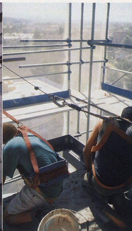
Die Arbeiten am neuen Hochhaus-Balkonturm geschehen in luftiger Höhe.