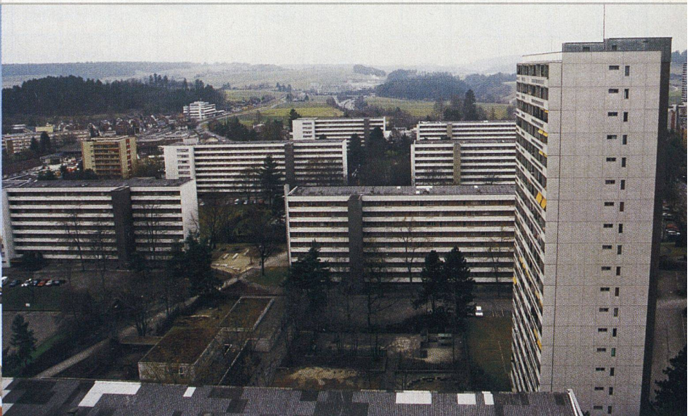
Die BewohnerInnen schätzen den grosszügigen Aussenraum ganz besonders.

Das Herz des Tscharnnerguts ist der Dorfplatz mit Restaurant und verschiedenen Geschäften.