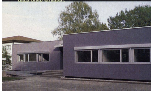
Die Grundstruktur des architektonisch gelungenen Baus blieb erhalten.