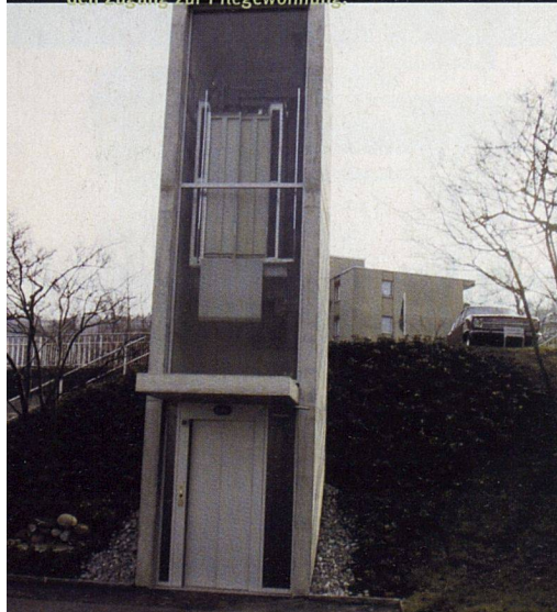
Ein neuer Liftturm erschliesst den Zugang zur Pflegewohnung.