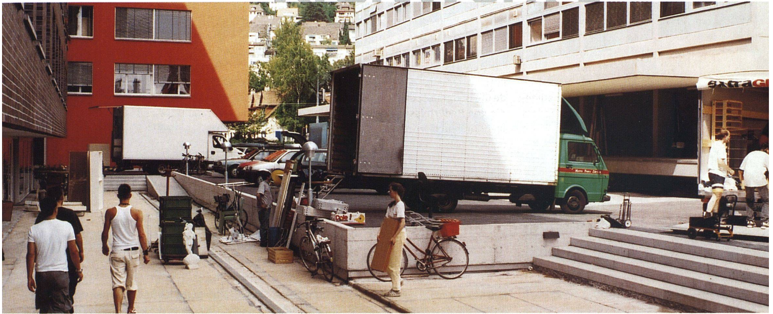
Letzten Sommer fuhren die Zügelautos vor.

Die Genossenschaftssiedlung KraftWerk 1 in Zürich West ist auf neue Wohn- und Lebensformen ausgerichtet. Sie bietet vielfältigen Wohnraum, der Gemeinschaften von bis zu zwanzig Menschen möglich macht. Verschiedene gemeinsame Einrichtungen wie die «Pantoffelbar» bieten sich zudem als Treffpunkte an. Vor einigen Monaten sind die BewohnerInnen eingezogen – hier ein erster Erfahrungsbericht.