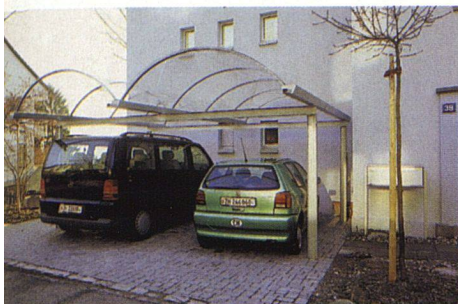
Offener Unterstand für Autos

Wer hat nicht schon immer nach einem Unterstand für Autos Ausschau gehalten, der nicht nur funktionell, sondern auch ästhetisch ist? Nun gibt es ihn: Car-Cupol ist der ideale Unterstand, der das Fahrzeug vor jeder Witterung optimal schützt. Filigrane, feuerverzinkte Stahlträger bilden das Gerüst, welches das gebogene Dach aus klar transparentem Acrylglas trägt. Car-Cupol wirkt leicht und unaufdringlich. Und dank der Elementbauweise kann der Unterstand für eine beliebige Anzahl von Autos gebaut werden. Eine Erweiterung oder ein Umbau ist auch noch nach Jahren möglich. Was die Wartung betrifft, ist Car-Cupol anspruchslos. Der Hersteller empfiehlt ledig-