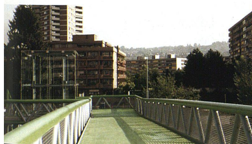
Die neue Passerelle soll die «Insel» Grünau mit Zürich-Altstetten verbinden.