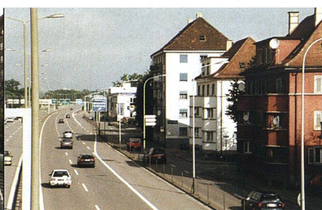
Das Rauschen der A1 gehört zur Grünau – und stellt eines der Hauptprobleme dar.