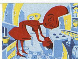
Illustration: Jürg Steiner