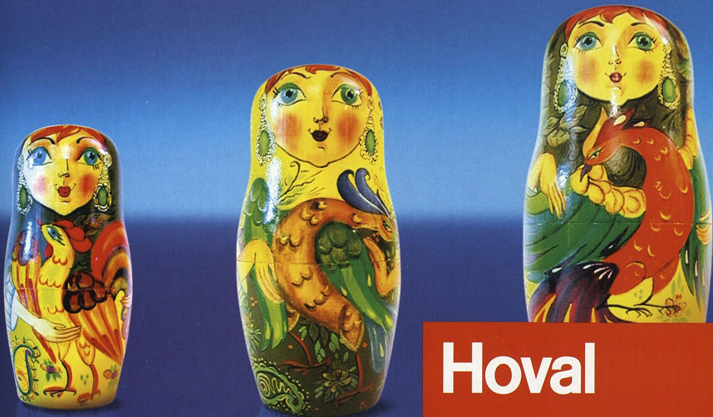
WALTHER UND PARTNER

13 Gebäude à 4 und 5 Wohnungen Bauherrschaft: Andreas Streich, Streich AG, Brüttisellen (ZH) Architekten: Sabina Hubacher und Christoph Haerle, Zürich Landschaftsarchitekt: Stefan Rotzler, Gockhausen Anlagekosten (BKP 1–9): 42 Mio. Fr. Bruttogeschossfläche 12 900 m 2 Kosten Fr./m 3 (BKP 2): 463 Fr. Kosten Fr./m 2 Bruttogeschossfläche 2150 Fr. (Nebennutzfläche von 100 m 2 eingerechnet, ohne Land)