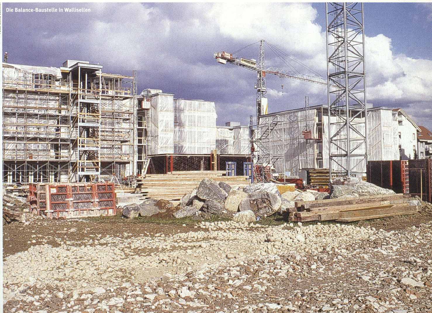
Die Balance-Baustelle in Wallisellen

Streich Abstriche gemacht? Sicher nicht bei der Fläche, im Gegenteil. Im Vergleich zu mancher Mietwohnung wird hier das Doppelte oder sogar Dreifache an Lebensraum geboten. Auch sonst weist die Überbauung etliche Qualitätsmerkmale auf, zum Beispiel sehr hochwertige Fenster, eine verglaste Solarfassade und eine hervorragende Wärmedämmung. Jede Wohnung ist mit einer kontrollierten Wohnungslüftung ausgestattet; hinsichtlich Energieverbrauch und