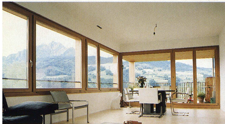
Grosse Fenster lassen viel Licht in die Wohnungen und geben den Blick in die schöne Umgebung frei.

Kanton Luzern für Wohngebäude mit drei Geschossen dieselben Anforderungen gelten wie in der übrigen Schweiz für solche mit zwei. Nichttragende Wände, flexible Grundrisse, Flachdecken und hoher Schallschutz in Kombination mit kontrollierten Wohnungslüftungen waren Bedingungen, die sich nur mit dem Einsatz von Stahlunterzügen erfüllen liessen. Guten Schallschutz, bei Eigentumswohnungen zentral, gewährleisten bei der Stirnrüti beplankte Rahmenbauwände und Bretterstapeldecken mit abgehängten Gipskartonplatten. Die Installationsebenen, die sich zwischen den Schichten ergaben, wurden zusätzlich gedämmt, und damit erreichte man den verlangten K-Wert von 0,20 \text{ W/m}^2\text{K} .