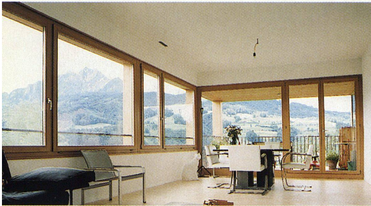
Grosse Fenster lassen viel Licht in die Wohnungen und geben den Blick in die schöne Umgebung frei.

Kanton Luzern für Wohngebäude mit drei Geschossen dieselben Anforderungen gelten wie in der übrigen Schweiz für solche mit zwei. Nichttragende Wände, flexible Grundrisse, Flachdecken und hoher Schallschutz in Kombination mit kontrollierten Wohnungslüftungen waren Bedingungen, die sich nur mit dem Einsatz von Stahlunterzügen erfüllen liessen. Guten Schallschutz, bei Eigentumswohnungen zentral, gewährleisten bei der Stirnrüti beplankte Rahmenbauwände und Bretterstapeldecken mit abgehängten Gipskartonplatten. Die Installationsebenen, die sich zwischen den Schichten ergaben, wurden zusätzlich gedämmt, und damit erreichte man den verlangten K-Wert von 0,20 \text{ W/m}^2\text{K} .