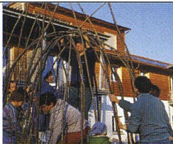
Illustration: Jürg Steiner