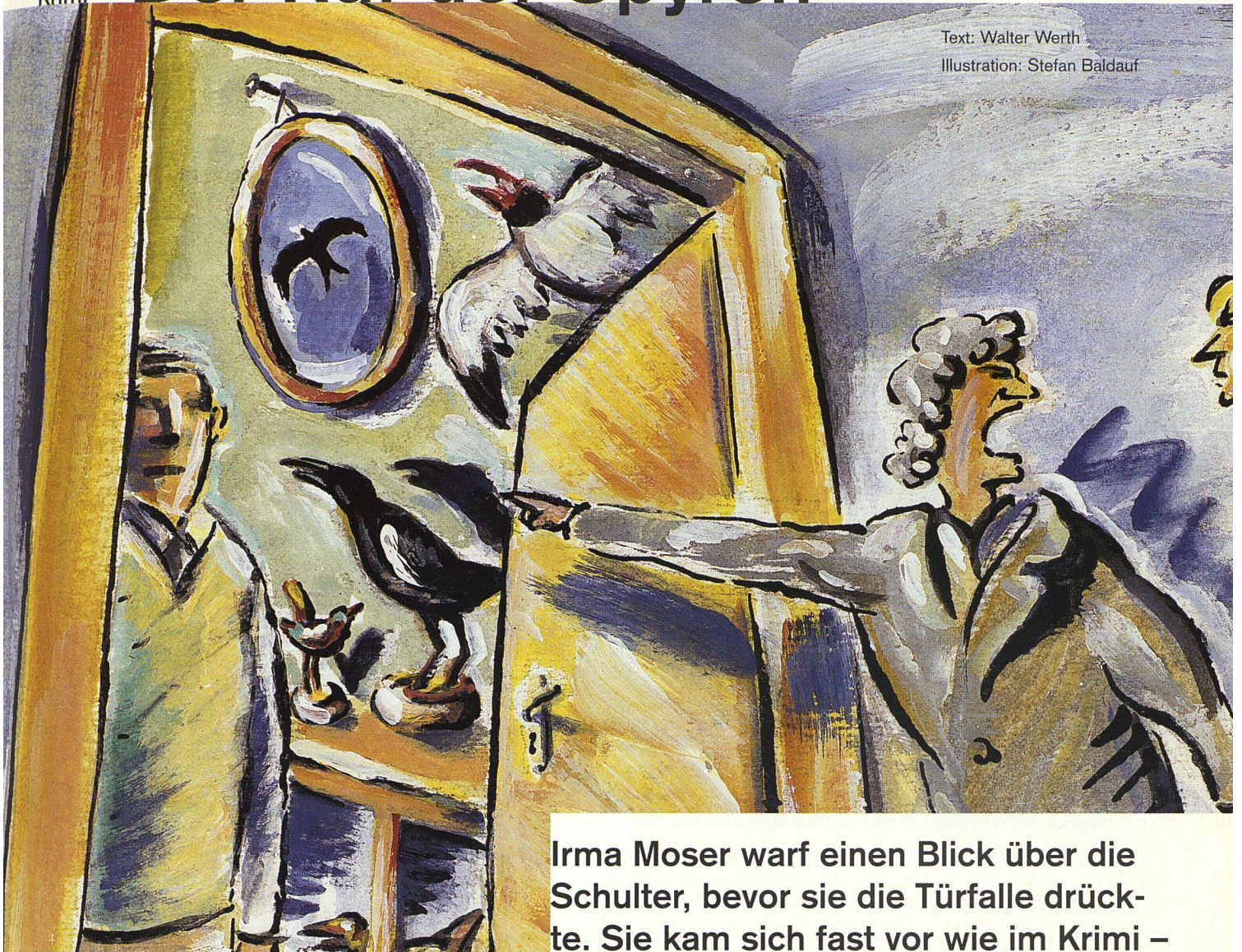
Illustration: Stefan Baldauf

Irma Moser warf einen Blick über die Schulter, bevor sie die Türfalle drückte. Sie kam sich fast vor wie im Krimi – und ausserdem ein wenig lächerlich. Niemand hatte sie eintreten sehen.