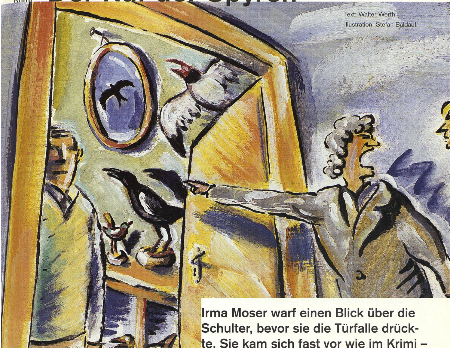
Illustration: Stefan Baldauf

Irma Moser warf einen Blick über die Schulter, bevor sie die Türfalle drückte. Sie kam sich fast vor wie im Krimi – und ausserdem ein wenig lächerlich. Niemand hatte sie eintreten sehen.