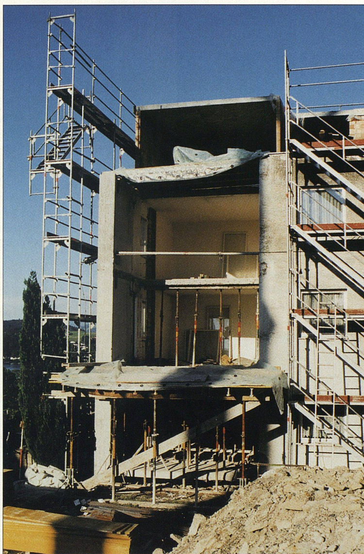
Das Leben war eine Baustelle – während 12 Wochen mussten die Mieter auf ihr Wohnzimmer verzichten.