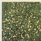
Weissklee Klee erstickt im Rasen die gewünschten Gräser, macht die Rasenflächen fleckig und anfällig gegenüber Belastungen.