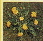
Löwenzahn Zähe, mehrjährige Pflanze. Die kräftige Pfahlwurzel dringt oft tiefer als 50 cm in den Boden ein.