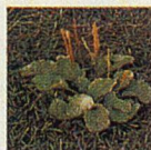
Breitwegerich Die 7–14 cm breiten Blätter liegen rosettenförmig am Boden und nehmen dem Rasen die Möglichkeit zur Ausdehnung.