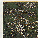
Gänseblümchen Schön, aber gefährlich. Diese mehrjährige Unkrautpflanze verdrängt schnell die Rasengräser und zerstört damit den wertvollen Rasenteppich.