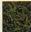
Schafgarbe Die gefiederten Blätter bilden am Boden eine Rosette und rauben so dem Rasen den nötigen Platz.