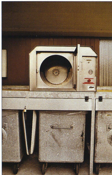
Das Wiegesystem «Wicomat» lässt sich mit den alten Containern kombinieren.

FREIE WAHL IN BASEL Die Alternativen gibt es, Basel probiert sie aus. Seit Anfang Jahr können alle Bewohnerinnen und Bewohner der Rheinstadt so entsorgen, wie es ihnen passt: Entweder wie gehabt per Gebührensack, in Basel «BebbiSagg» genannt. Oder sie schaffen sich einen Plastikcontainer an, lassen ihn mit einem Chip ausrüsten und stellen ihn bei Bedarf zu den gewohnten Terminen an den Strassenrand. Bei der Leerung wird er gewogen und der persönliche Chip abgelesen. Monatlich flattert eine Rechnung mit den geschuldeten Abfallgebühren in den Briefkasten.