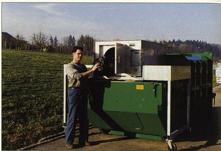
Grosse Presscontainer mit Wiegeeinrichtung schlucken viel Kehricht.

paar Quadratmeter im Freien, beispielsweise neben einer Wertstoff-Sammelstelle oder bei der Garagenauffahrt. Grünpflanzen helfen, das wenig ansehnliche Möbel zu kaschieren. Beim externen Container kann es ein beliebiger Transporteur sein, der den Behälter direkt zur Verbrennung fährt (Bring-System). Kleiner Nachteil: Während der Leerungszeit kann kein Abfall eingeworfen werden.